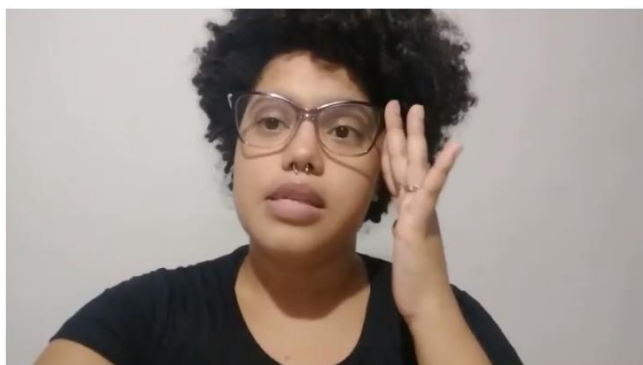
Exploração do corpo bioplasmático durante sessão do Espaço Terapêutico Remoto